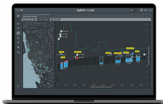
Dashboard SSO/CSO Prediction and Prevention che mostra in tempo reale la capacità disponibile nei principali collettori intercettori di BSA, con avvisi di sovraccarico, riflusso o sfioro.

I responsabili comunali erano consapevoli che non fosse più sostenibile gestire il sistema come avveniva dagli anni '50; al tempo stesso, investimenti onerosi in nuove infrastrutture "grigie" (ad esempio tunnel e grandi vasche di accumulo) risultavano non fattibili per alcune porzioni della rete.